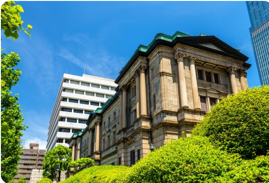
Bank of Japan building in Tokyo

Un'inflazione core superiore alle attese potrebbe costituire il presupposto per un aumento dei tassi di interesse da parte della Banca del Giappone a luglio. Prevediamo che la BoJ aumenterà i tassi di 25 punti base, per poi mantenerli stabili per un periodo considerevole a causa dell'elevata incertezza sui dati statunitensi.