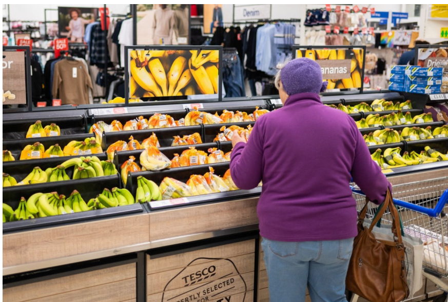
UK food prices actually dropped in September

Sia l'inflazione dei prodotti alimentari sia quella dei servizi sono inferiori alle previsioni della Banca d'Inghilterra. Insieme alla crescita salariale più debole, i due dati aumentano la probabilità di un altro taglio dei tassi nel 2025. Ora tutto dipende dai dettagli del bilancio autunnale in arrivo a novembre.