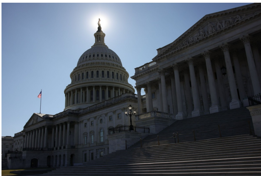
US Capitol, Washington DC. Are US exceptionalism and the strong dollar a thing of the past?