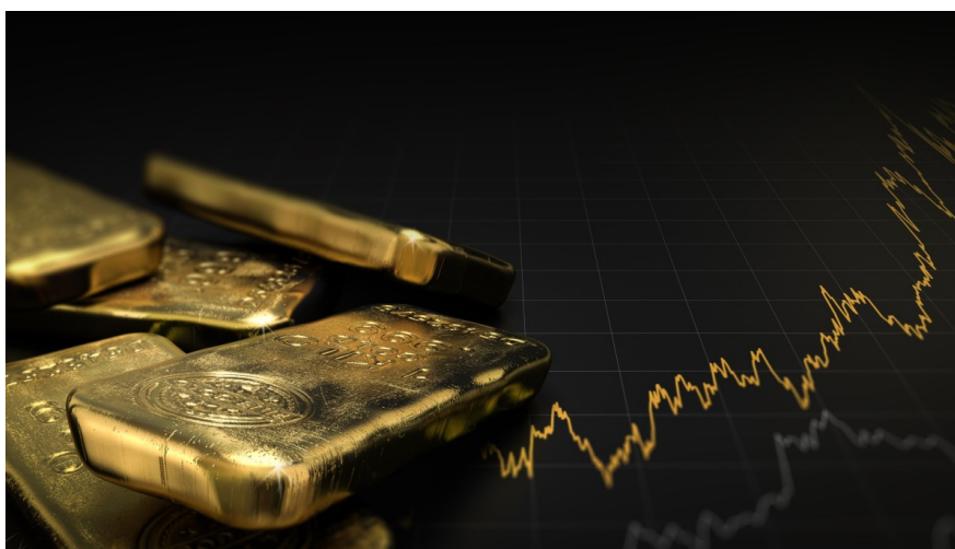
Gold has staged a historic rally, doubling in less than two years

I futures sull'oro per dicembre, il contratto più attivo, hanno superato per la prima volta i 4.000 dollari alla borsa di New York. Intanto, lo shutdown del governo americano si trascina nella sua seconda settimana