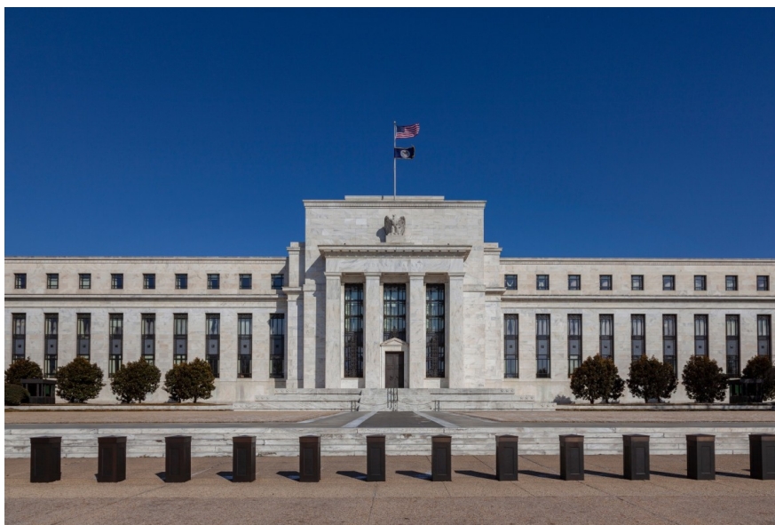
The Federal Reserve is widely expected to keep rates on hold

I dati e la risoluta difesa dell'indipendenza della banca centrale da parte del presidente della Fed Powell indicano che difficilmente vedremo un taglio dei tassi il 28 gennaio. La domanda chiave è un'altra: il sostituto di Powell riuscirà a convincere il resto del comitato a effettuare nuovi tagli?