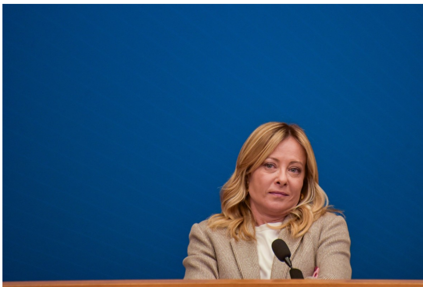
Italian Prime Minister Giorgia Meloni at a press conference last week

Nel 2026 prevediamo una modesta accelerazione del PIL italiano, trainata principalmente da consumi e investimenti, questi ultimi alimentati dall'imminente scadenza del recovery fund. La politica di bilancio resterà neutra, continuando ad aiutare l'economia attraverso il contenimento dei costi di finanziamento.