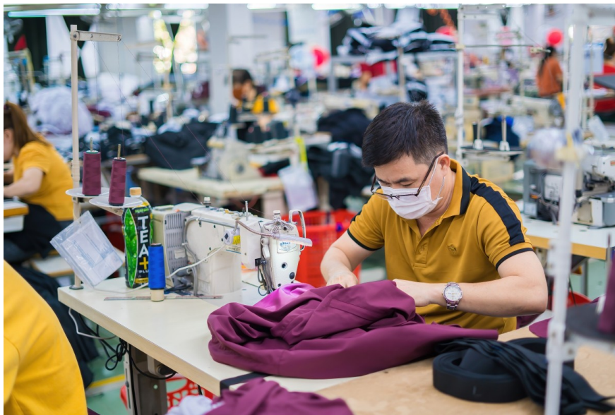
A textiles factory in Vietnam

Il Vietnam è il primo paese asiatico a siglare un accordo commerciale con gli USA. Da un lato, dazi più elevati sulle esportazioni a valore aggiunto e potenziali trasbordi in Paesi intermedi potrebbero danneggiare la crescita del PIL. Dall'altro, differenziali favorevoli potrebbero accelerare i cambiamenti nella catena di approvvigionamento.